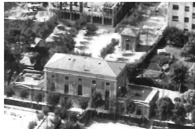
FOTOGRAFÍA AÉREA CASA-ADMINISTRACIÓN